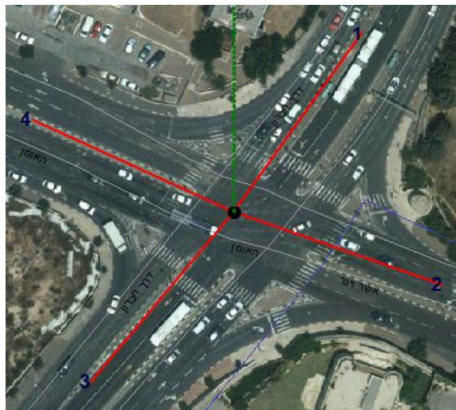
פיצול זרוע יוגדר כ- "זרועות משנה"