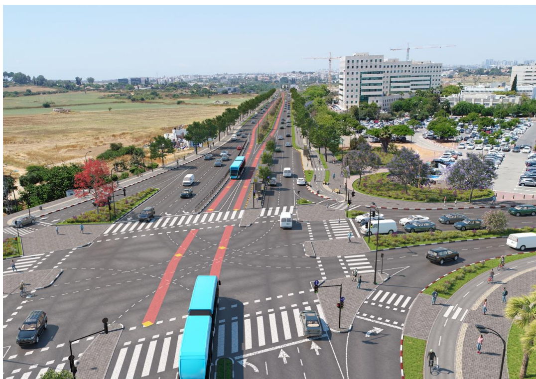
איור 1 - הדמייה של צומת המדע קו כחול (להמחשה בלבד)

מובא לידיעת המתמודדים כי תיאור הפרויקט כמפורט להלן הוא כללי ואינדיקטיבי בלבד. כן מובא לידיעת המתמודדים כי ייתכן ותכולת הפרויקט ו/או השירותים הנדרשים במסגרתו יהיו שונים מהמפורט להלן, הכול כפי שיפורסם במסגרת המכרזים הפרטניים.